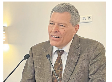
Griesheims Bürgermeister Geza Krebs-Wetzl. km-fotos