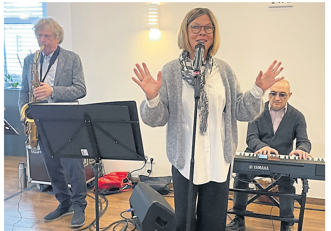
Johnny's Jazz Collection begleitete die Bürgerpreisverleihung mit gewohnt stilvollen Klängen.