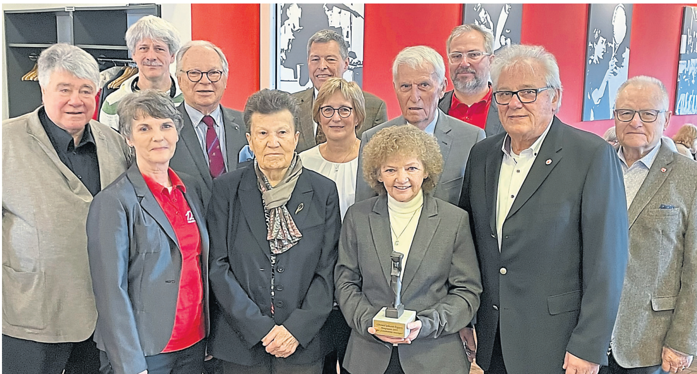
Die Preisträgerin umrahmt von den Veranstaltern und Gastgebern, dem Initiator, der Jury und Vertretern der Stadtpolitik.